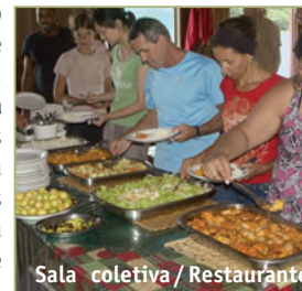
Sala coletiva / Restaurante

Todos os bangalôs possuem a proteção contra mosquitos e suas janelas são vedadas com redes mosquiteiras. Sob o nosso ancoradouro casa barco 13 na margem do rio Juma, encontram-se a sala de estar de uso livre, a sala de reunião, o restaurante e a nossa deliciosa cozinha . Uma atração a parte aos visitantes é o mergulho de cima da ponte nas águas quentes e lípidas do Rio Mamori . Uma experiência refrescante que ficará para sempre na memória.