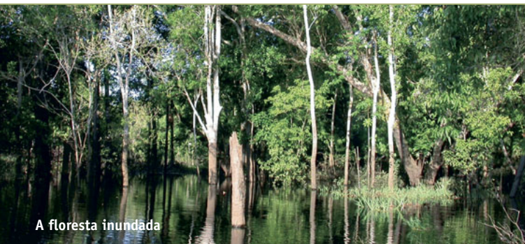
A floresta inundada

A autenticidade da fazenda faz com que a mesma se diferencie dos outros produtos turísticos da Amazônia. A fazenda convida seus visitantes a se integrarem com a família nativa e conhecer a vida original e natural na região Amazônica e seus habitantes. Juma Lake Inn é o lugar ideal para aqueles que querem experimentar a típica hospitalidade em um ambiente simples, natural e acolhedor . Com sua calorosa recepção, a deliciosa comida caseira e a atmosfera familiar, faz com que a fazenda receba dos seus visitantes um apreço especial de amor, poesia e respeito entre todos os seres da Amazônia na obediência às leis da Natureza com todos seus mistérios e encantos .